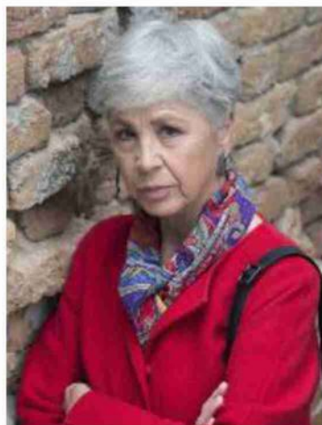
L'attrice Ottavia Piccolo