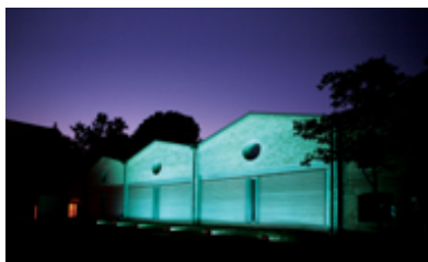
"Il giardino della memoria", Museo della Memoria di Ustica, Bologna

BOLOGNA – Venerdì 27 giugno 2014, ricorre l'anniversario della strage di Ustica . A 34 anni di distanza, la memoria dell'accaduto e delle 81 vittime viene tenuta viva al Museo per la Memoria di Ustica grazie all'installazione permanente creata da Christian Boltanski nel 2007 per la città di Bologna e alle attività per il pubblico previste per il periodo estivo. Per l'occasione il Museo sarà aperto al pubblico con un orario prolungato, dalle 17 alle 24.